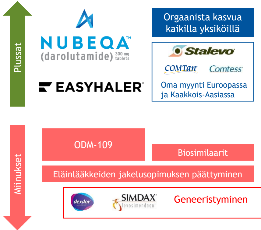
Liikevaihto (jatkuvat toiminnot) 2018-2020